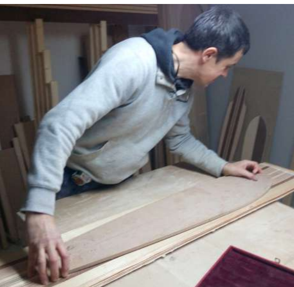
Andreano skate bat egiten.