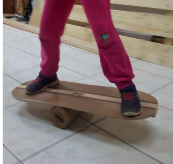
Abianen tauletako bat.